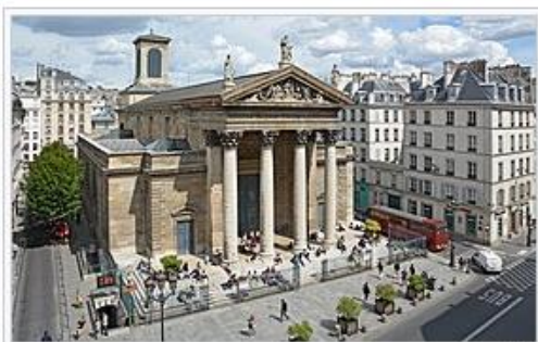
Notre-Dame de Lorette