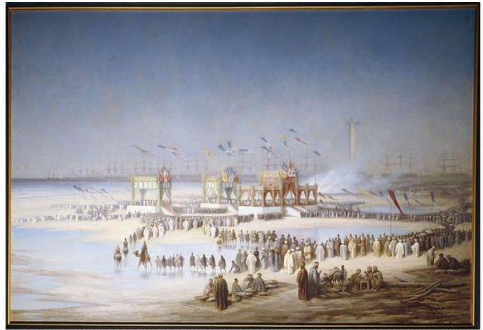
Edouard Riou (1833-1900) : Cérémonie d'inauguration du Canal de Suez à Port-Saïd, le 17 novembre 1869

Mille personnes ont été invitées, toutes les têtes couronnées d'Europe se sont déplacées ( la reine Victoria exceptée, opposée au projet ).